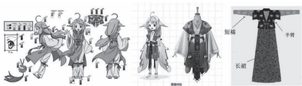
图1 动画角色服饰与唐代半臂襦裙的对比

中国有关狐的动画大多改编于中国古典神话，《狐妖小红娘》便是由古典神话改编的同名漫画，在狐妖转世续缘的神话基础上创作而成，因此狐妖红娘这一职业就此诞生。故事背景设定为一个架空世界，人与妖共存，女主角是一只狐妖，男主角是一名道士，两个人联手为转世情侣们寻回前世情缘。主角涂山苏苏的形象如图1所示，在造型设计上，穿着宽口短袖、交领右衽和齐腰襦裙的汉服，跟中国唐代的半臂襦裙相似，但是又有特别的剪裁，具备现代风格，腰处还有红色流苏腰带设计。在服装的色彩搭配上，粉红和白色的暖色调更贴合主角热情和活力的特性。发色为金橘色，属于黄色系，这是最显著和亮丽的颜色，让人获得一种明朗和积极向上的感觉。