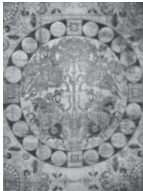
图7 烟色地狩猎纹印花绢 图8 四大天王狩狮纹锦