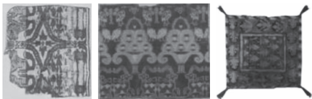
图1 联珠胡王锦（现藏于新疆维吾尔自治区博物馆） 图2 绿地对鸟对羊灯树文锦（现藏于新疆维吾尔自治区博物馆） 图3 树叶纹鞍毯（现藏于新疆维吾尔自治区博物馆）

代表性的文物，分别是联珠胡王锦（见图1）、绿地对鸟对羊灯树文锦（见图2）、树叶纹鞍毯（见图3）。通过这三件文物可以看出，汉代至魏晋这一时期，丝绸的整体构造形式并无太大的改变，但这三种纺织品的图案主体有明显的不同：“联珠胡王锦”主要以人物牵骆驼过水，水面倒映以对波形式表现，并在人物与骆驼间有“胡”“王”二字；“绿地对鸟对羊灯树”的底色为绿，画面中有对称的鸟、对称的羊、对称的灯树；“树叶纹鞍毯”中的图案规整，中心是菱形填充小树叶，四周大树叶，边框为几何样。这几种图案表现形式是我国古代一直沿用的对称及带状循环构图样式。