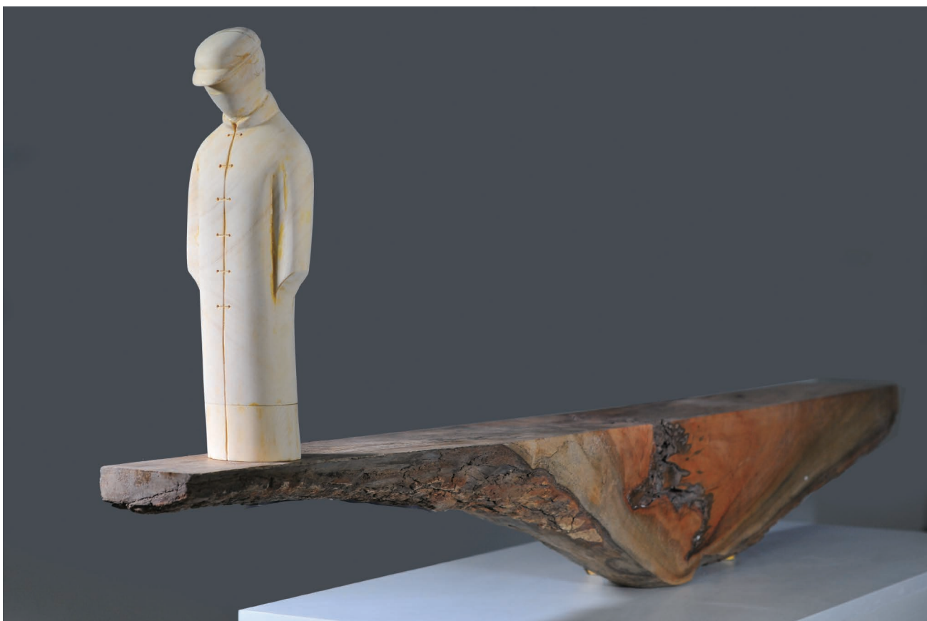
《边缘》 木制 2012年