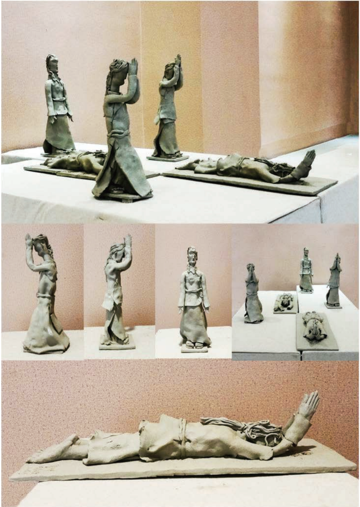
《向往》 陶制 2015年